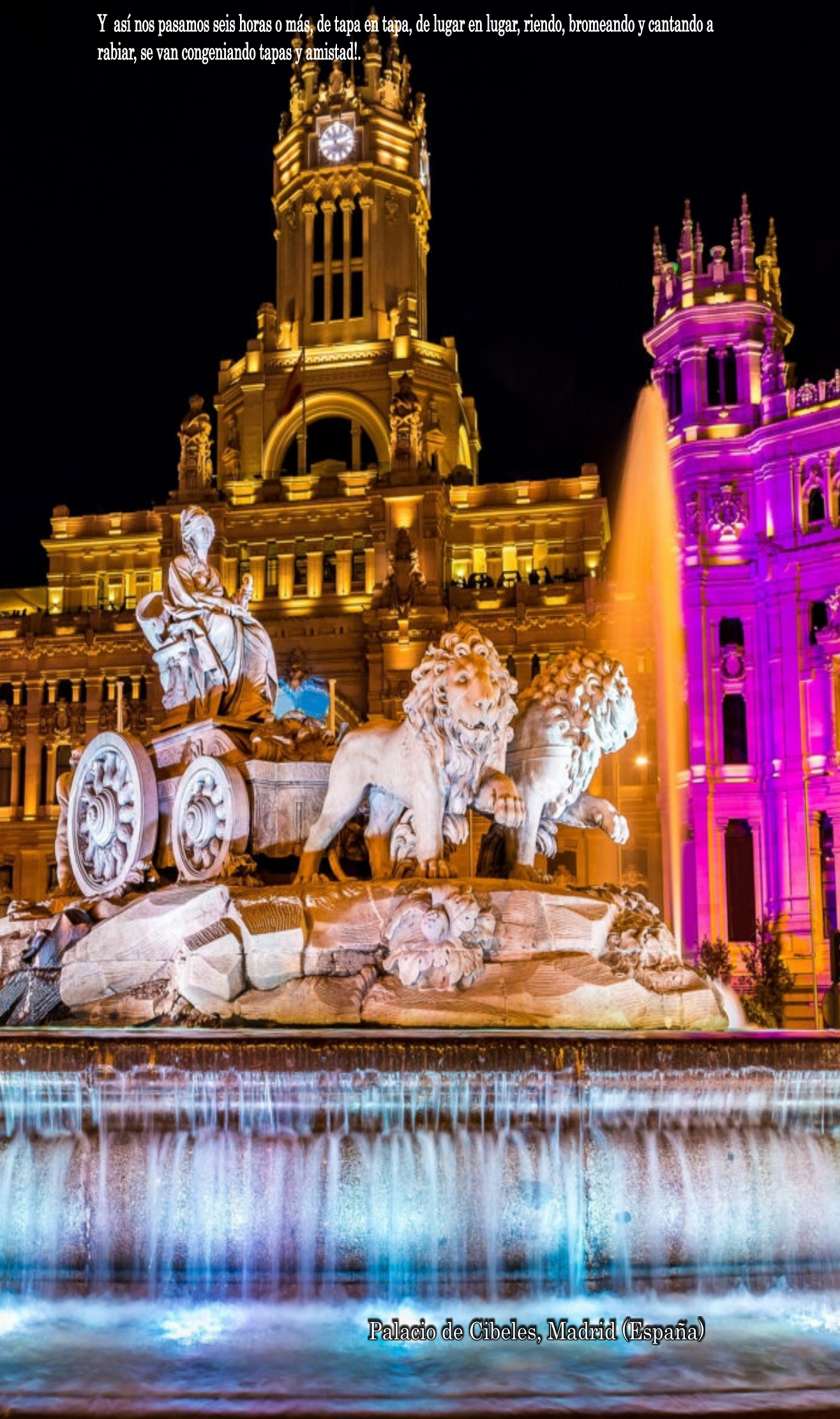
Palacio de Cibeles, Madrid (España)

Y así nos pasamos seis horas o más, de tapa en tapa, de lugar en lugar, riendo, bromeando y cantando a rabiar, se van congeniando tapas y amistad!.