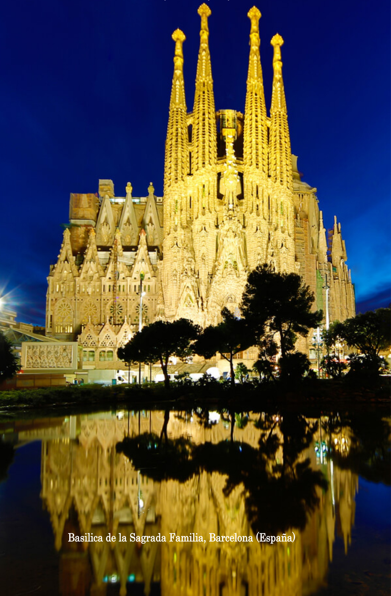
Basilica de la Sagrada Família, Barcelona (España)